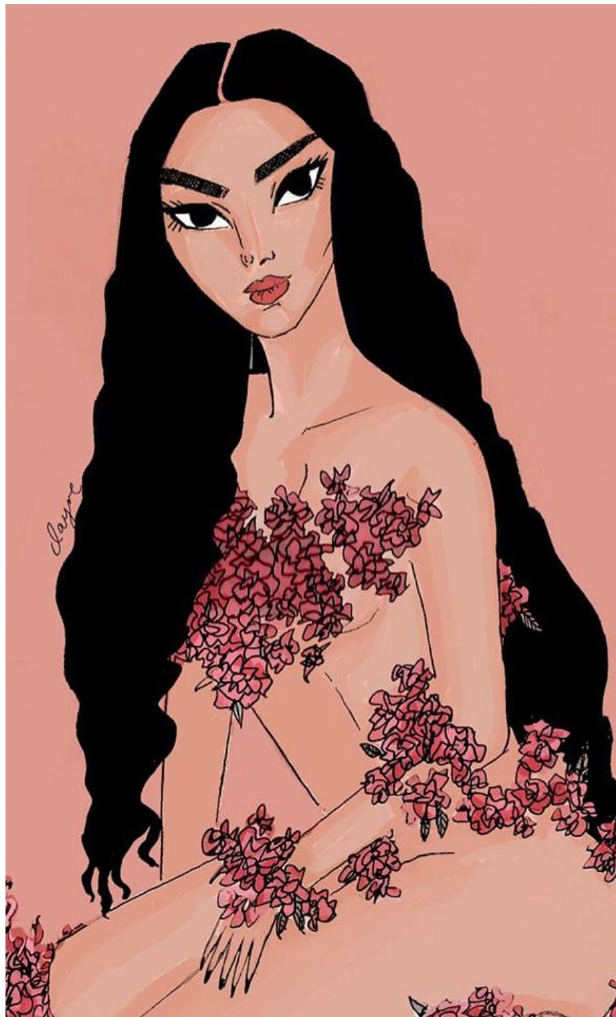
Ilustración: Clara Trash